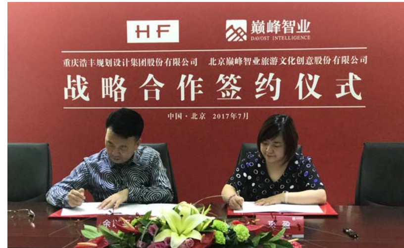
集团领导 7月17日赴北京签署战略合作协议

今后，巅峰智业将以中国旅游全链条服务模式，结合浩丰在“智力创新 + 技术服务 + 项目管理 + 资本孵化”等方面的优势，双方共同为客户提供高价值的独特解决方案，通过深度、广泛、协同的合作，覆盖全领域、跨越全行业，打造更多精品项目。巅峰与浩丰将共同促进平台、资源、品牌及培训的共建共享，形成联合体共同体，利用各自专业优势发挥合力效应，做大做深旅游产业链。双方亦对彼此的合作充满信心：双方紧密战略合作伙伴关系的建立，必将为彼此的发展注入强劲动力，共同为中国旅游投智、添彩！